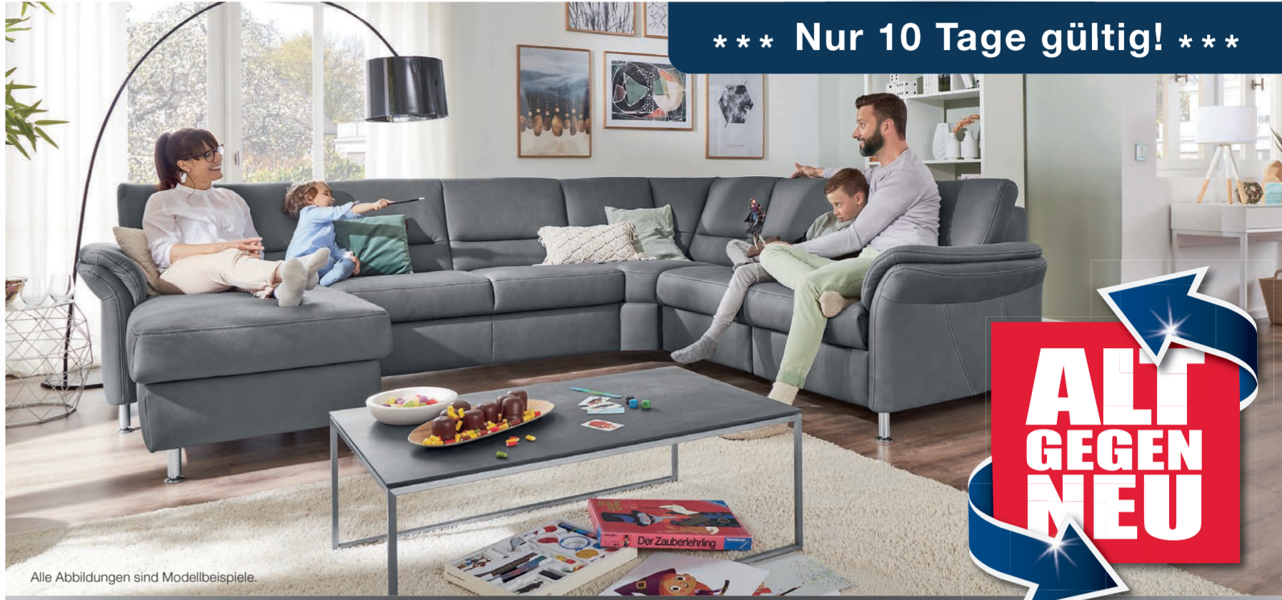
Alle Abbildungen sind Modellbeispiele.